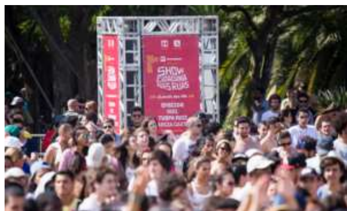
FESTIVAL DE DIREITOS HUMANOS REÚNE MAIS DE 30 ATIVIDADES EM SÃO PAULO