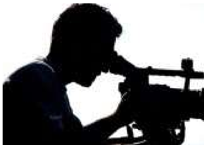
ENTRETODOS: FESTIVAL DE CURTAS QUER HISTÓRIAS SOBRE REFUGIADOS