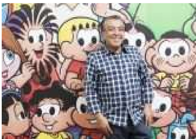
MAURICIO DE SOUSA É ATRAÇÃO DE 1º FESTIVAL GEEK DE SANTOS