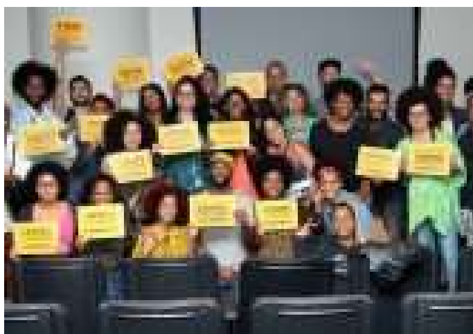
FESTIVAL #15CONTRA16 REÚNE MÚSICOS E ATIVISTAS CONTRA REDUÇÃO DA MAIORIDADE PENAL