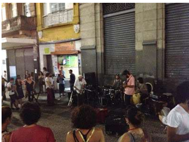
Jazz, com lampejos de metaaaaaaal...