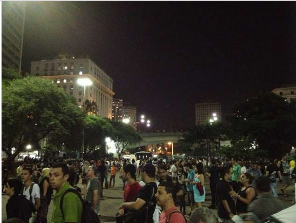
Lá no fundo, a Prefeitura e o Viaduto do Chá. No meio, o povo vagando e pirando...